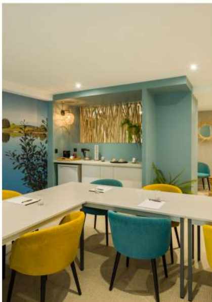
Salle les nymphéas, Hôtel restaurant Spa de l'Abbaye

A votre disposition pour une demi-journée, journée d'étude, séminaire résidentiel ou un moment convivial (présentation de produit...)