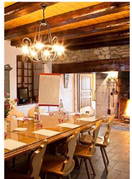
Gîtes 5* La ferme de Marguerite